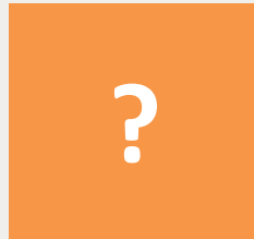
Esperti esterni da individuare Sulla base delle esigenze che emergeranno dalla manifestazione di interesse